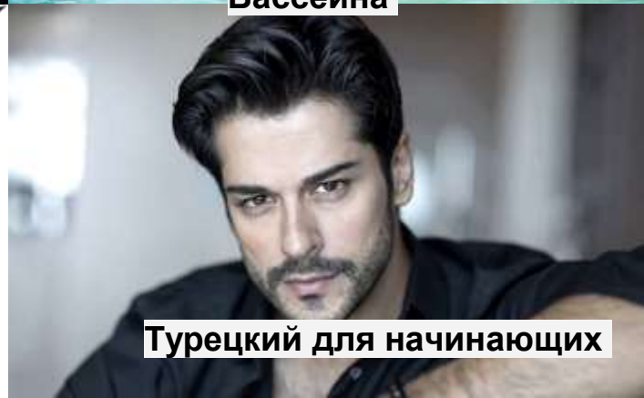
Турецкий для начинающих