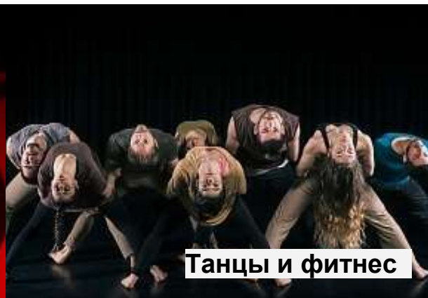
Танцы и фитнес